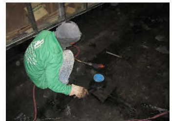
งานท้อและขอบ