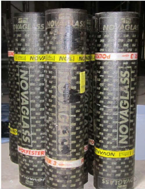
วัสดุ Self-Adhesive waterproofing membrane