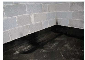
งานรอยต่อเข้ามุม