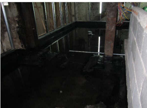
ทดสอบน้ำ

Site : งานร้านอาหารสีฟ้า ซอย ทองหล่อ พื้นที่ : ห้องครัว 45 ตารางเมตร ปูทับสองชั้น วัสดุ : แผ่นยาง Self-Adhesive waterproofing membrane