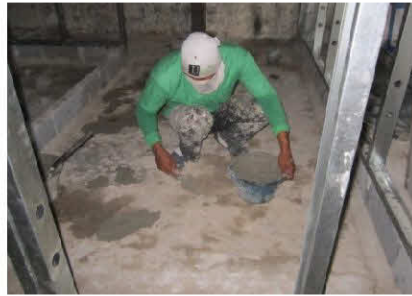
เตรียมผิวหน้า